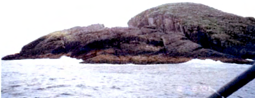
Foto 16. Islas Ildefonso occidental (N° 121). Paridero de lobo fino.