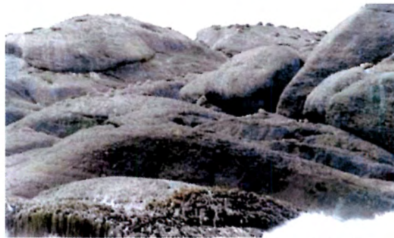
Foto 4. Isla en Grupo Vorposten (N° 4). Apostadero de lobo común y paridero de lobo fino.