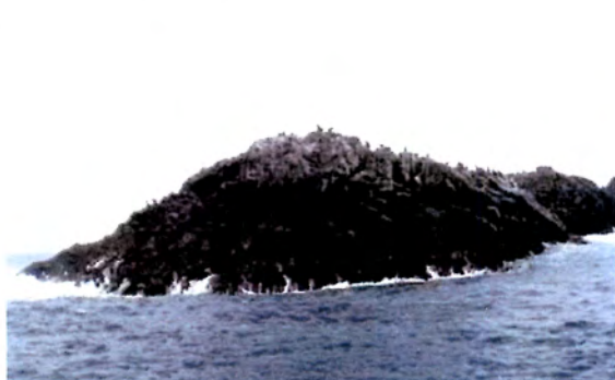
Foto 3. Stortebecker, Isla Huber (N° 3). Apostadero de lobo común.