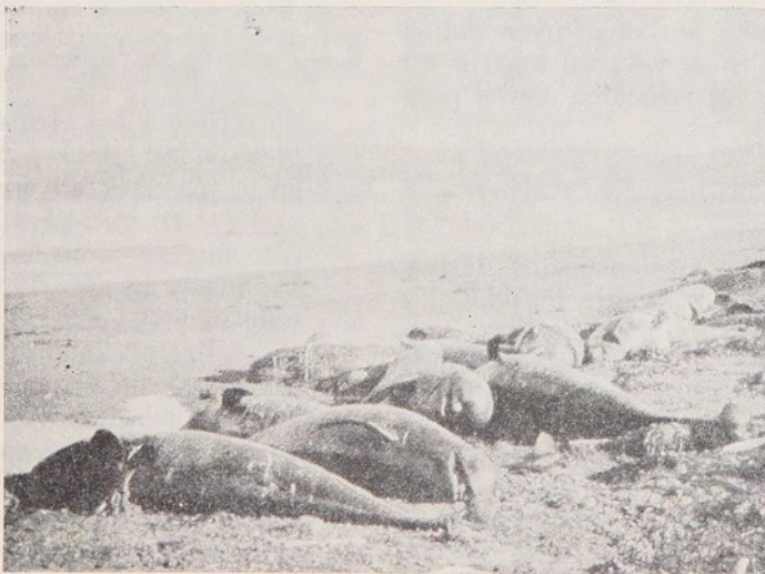
Fig. 2.— Vista hacia el sur-oeste de un sector de playa arenosa con alta concentración de ejemplares de ballena piloto, en el nivel supralitoral.