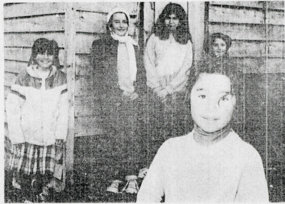
Los habitantes de Caleta María serán los principales beneficiados con la construcción del nuevo camino.