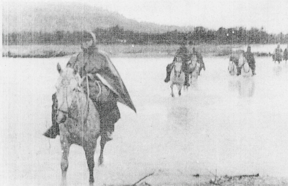
Los capotes facilitados por el Ejército ayudaron a protegerse de la lluvia.

huella de los animales en paso expedito para los viajeros.