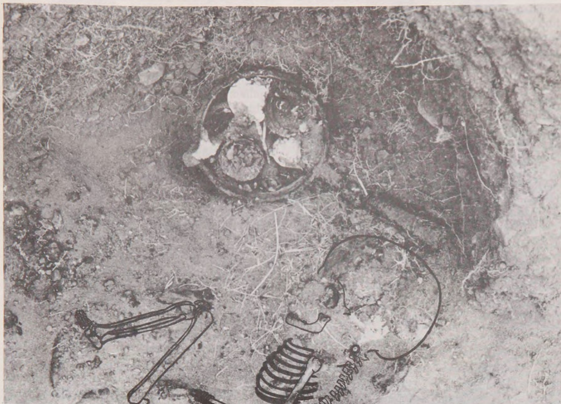
Fig. 2.- Fondo de la tumba en donde se resalta la posición del esqueleto y la disposición de la cacerola.

cayendo de las paredes de la cárcava, este trabajo venía a insertarse en el proyecto Arqueología Histórica de la Región de Magallanes y encontraba su sentido precisamente en el desarrollo del mismo; antes no se contaba con los suficientes elementos de juicio, para integrar esta información en un conjunto con sentido.