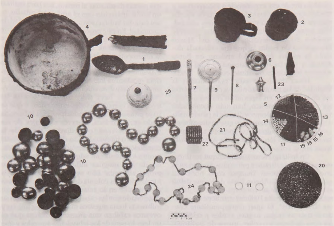
Fig. 4.- Fotografía en que se aprecian los objetos hallados junto al esqueleto de la niña (falta el asador).

la cabeza entre las rodillas, con plateados en el pelo y hermosos brazaletes en los brazos que están aferrados a las piernas [ ... ]. Cualquier ornamento de plata y todo el equipaje y pertenencias era siempre enterrado por ellos con la persona en la tumba y quemaban todas las ropas que le habían pertenecido."