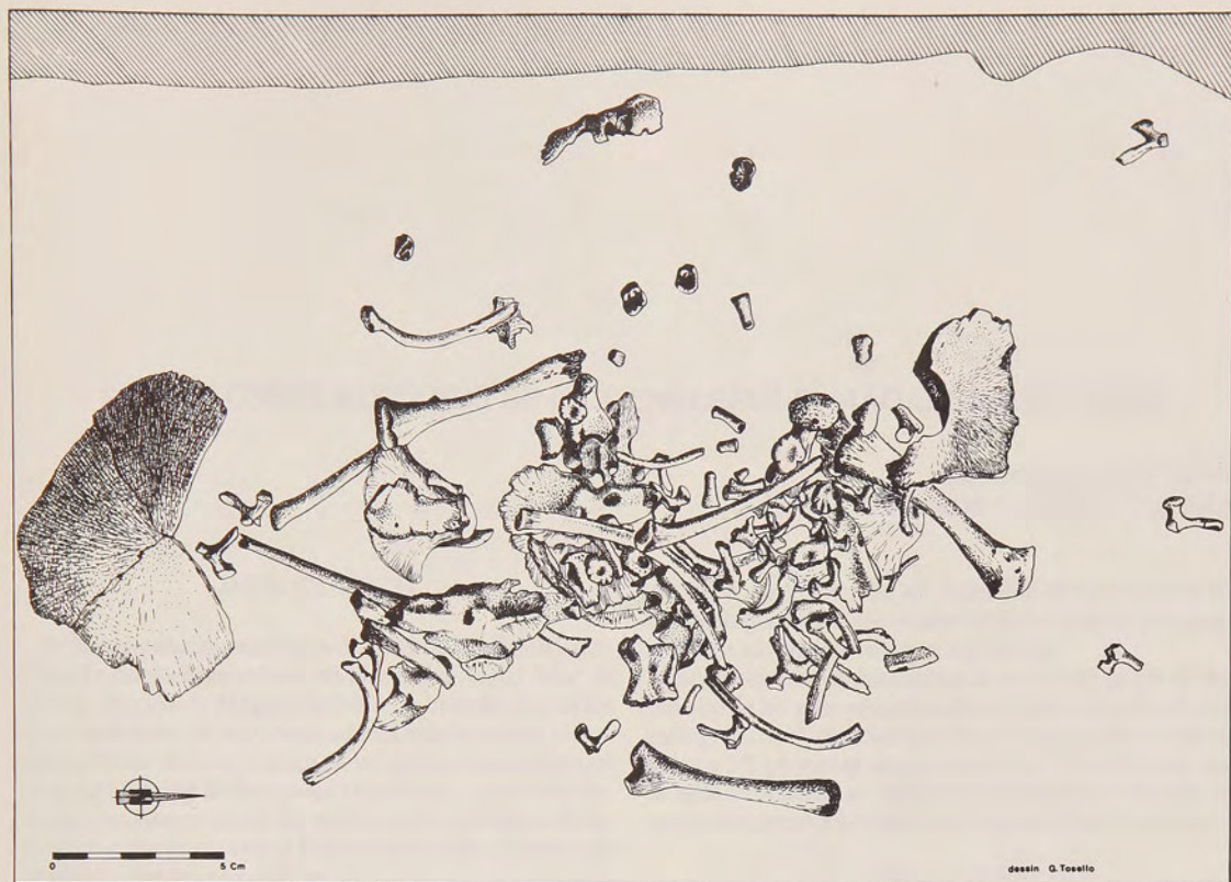
Figura 2: Posición de los huesos en la tumba

zamiento posterior a su deposición inicial, viene a invalidar esta hipótesis.